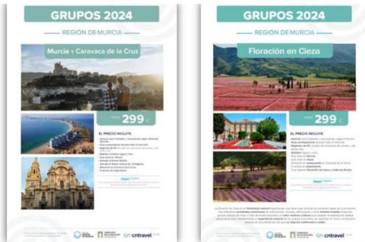
Pantallazos del producto creado para grupos.

Lote 4 de CN travel de B2b Multidestino que incluye creación de producto paragrupos incluyendo estos dos de naturaleza: