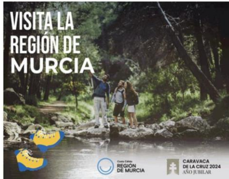
Diseño 3: La Región de Murcia es auténtica, sin artificios..... es natural: