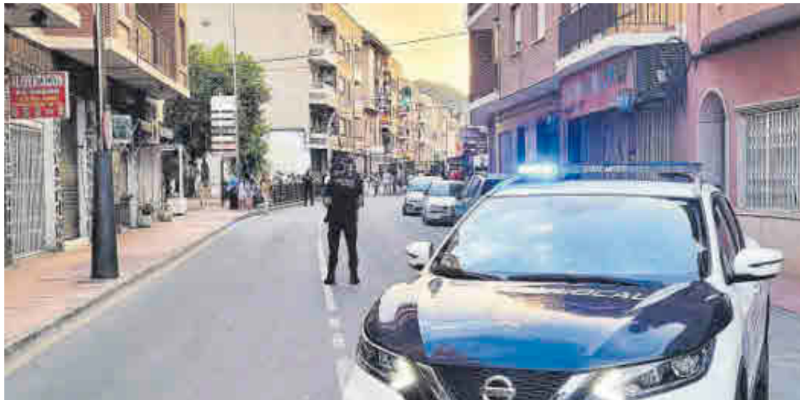
Policía Local de Blanca durante un acto celebrado en el municipio murciano.

► El PSOE denuncia al alcalde por no haber firmado a tiempo los decretos y fuentes municipales dicen que las multas son de la etapa socialista