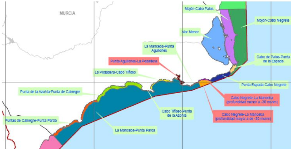
Figura 1. Masas de agua costeras del litoral de la Región de Murcia. En verde, las masas de agua naturales; y, en rojo, las masas muy modificadas.

Se establecen 71 estaciones de muestreo cuyas coordenadas UTM ETRS89 (Huso 30N) y descripción se detallan en el Anexo I de este PPT. Se diferencian dos áreas de muestreo independientes, con características diferenciadas, aunque las dos integradas en la misma RCAg: el “ Mar Menor ” (laguna costera del Mar Menor), a la que corresponden 22 estaciones de muestreo; y, el “ Resto del Litoral de la Región de Murcia ”, que abarca desde las costas de San Pedro del Pinatar hasta las costas de Águilas, a la que corresponden 49 estaciones de muestreo.