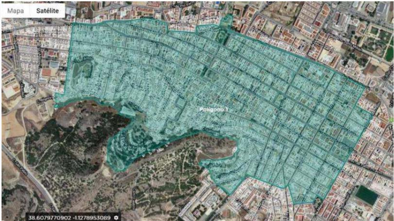
Delimitación del ERRP, incluyendo parcelas catastrales.