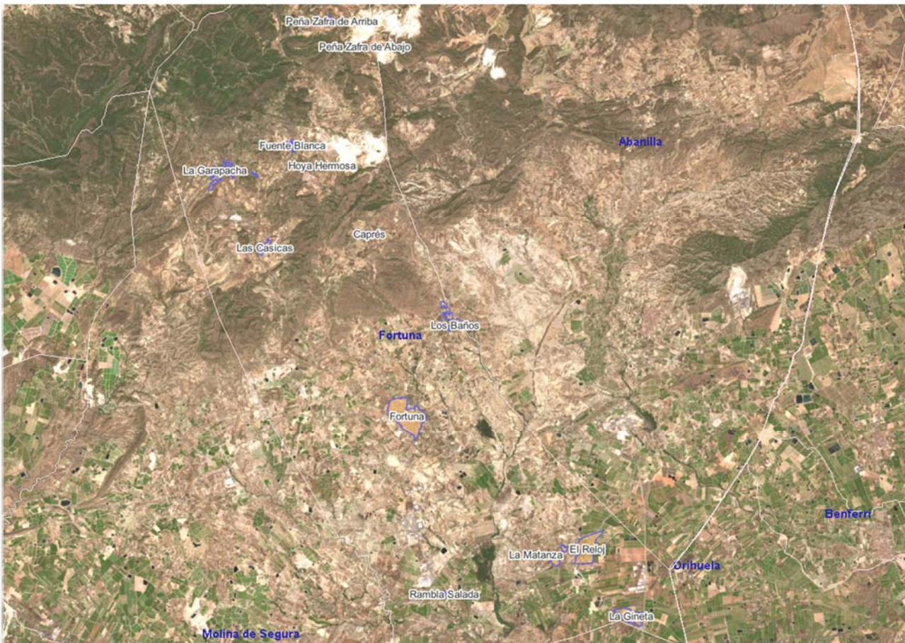
Localización del ERRP en el municipio de Fortuna.