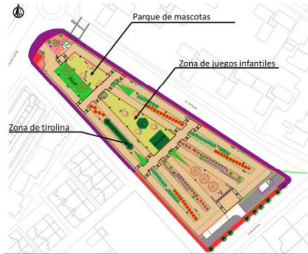
FIGURA 3: PLANTA PROPUESTA DE ACTUACIONES EN PARCELA

El proyecto presentado asimila el sistema de detención de aguas pluviales propuesto como una técnica de drenaje urbano sostenible (TDUS) que pretende un almacenamiento temporal esas de aguas pluviales y su descarga en diferido a la red de saneamiento existente aguas debajo de la parcela. Además, como la cubierta de los depósitos es transitable, el proyecto presentado plantea una superficie superior ajardinada.