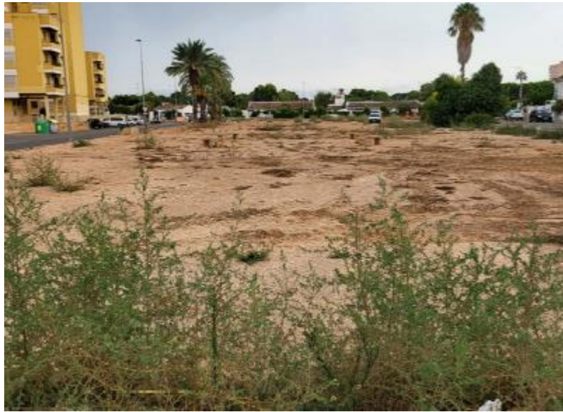
FIGURA 1: ESTADO ACTUAL DE LA PARCELA SEGÚN PROYECTO PRESENTADO.

De acuerdo a la documentación presentada, las obras proyectadas se pueden englobar en dos grupos: