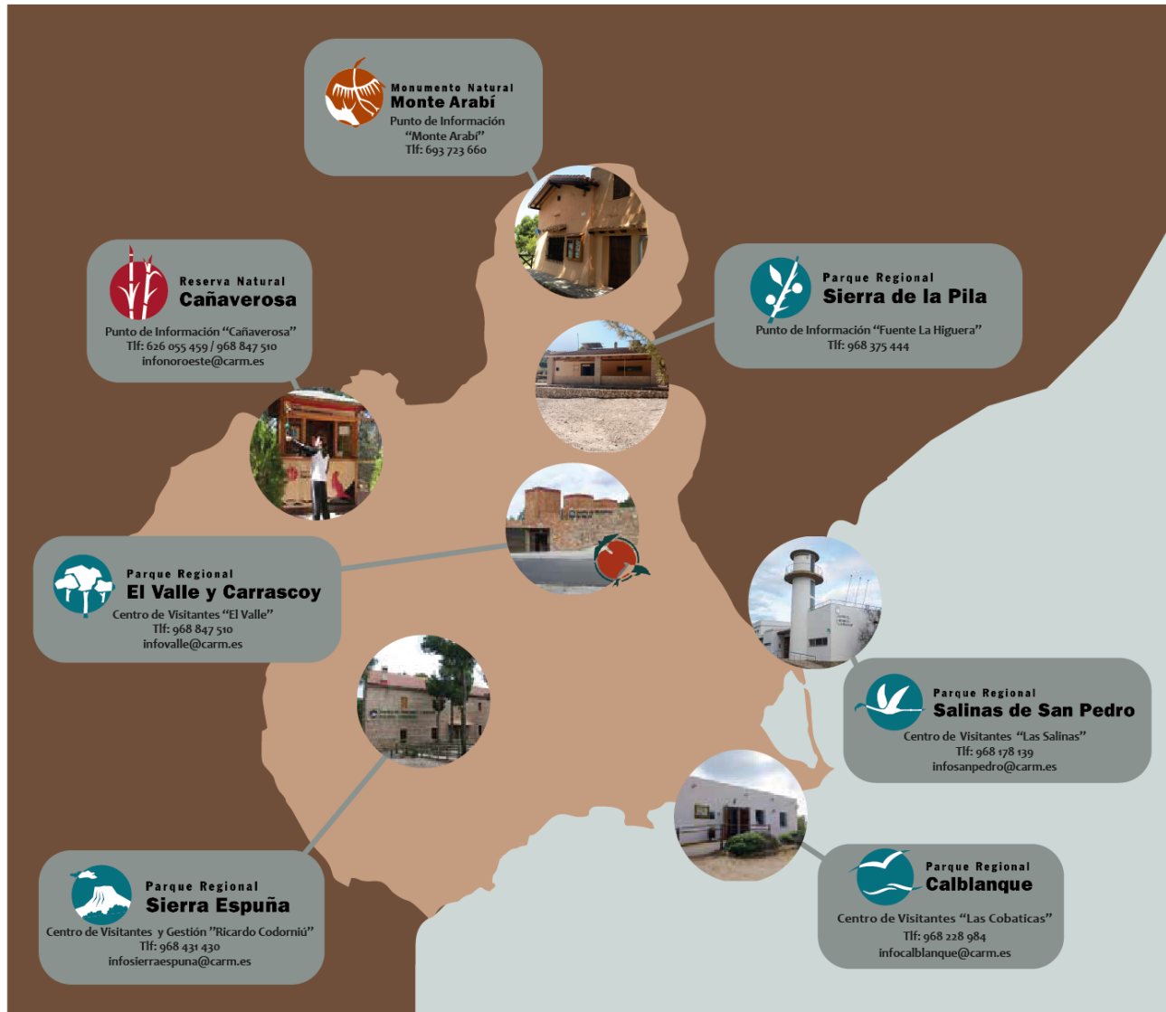
Figura 1: Distribución territorial de los principales equipamientos de uso público que darán soporte a las actividades definidas en el presente Pliego.