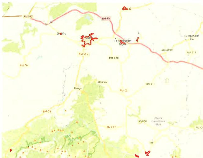
Localización del ERRP en el municipio de Mula.