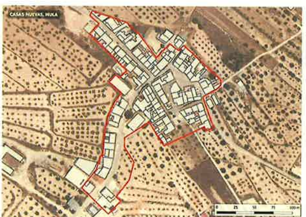
• Ámbito Casas Nuevas