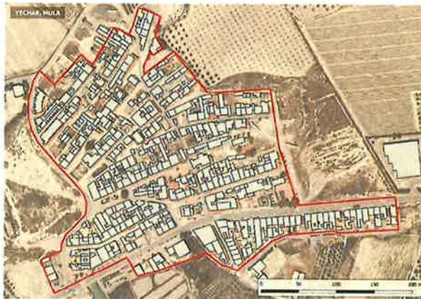
• Ámbito Yechar