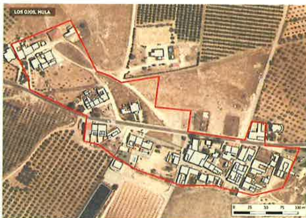
• Ámbito Los Ojos