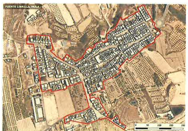
• Ámbito Fuente Librilla