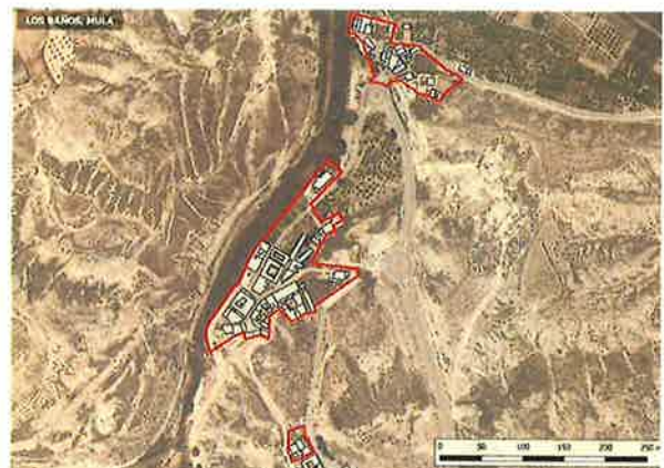
• Ámbito Los Baños