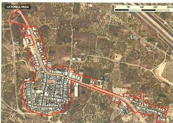
• Ámbito La Puebla