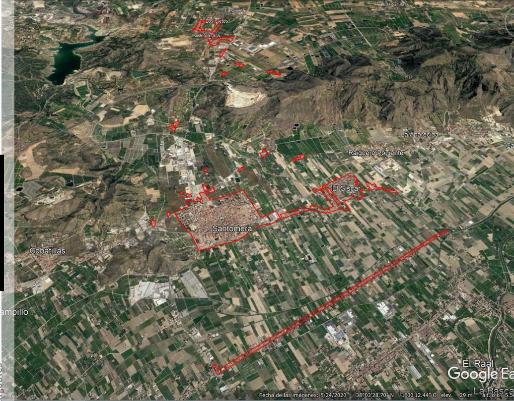
Localización del ERRP en el municipio de Santomera.

FIRMADO por : SANCHEZ ROCA, INMACULADA. A fecha: 27/10/2022 12:43 PM FIRMADO por : LAJARA MARTINEZ, JOSE FRANCISCO. DIRECTOR GENERAL DE VIVIENDA. A fecha: 27/10/2022 12:56 PM FIRMADO por : MARTIN RAMIRO, FRANCISCO JAVIER. DIRECTOR GENERAL DE VIVIENDA Y SUELO. A fecha: 28/10/2022 06:24 PM 4A6EZ Total folios: 10 (9 de 10) - Código Seguro de Verificación: Verificable en https://sede.mtma.gob.es