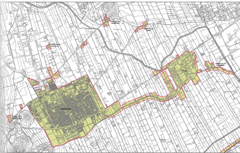
Ámbito Santomera, Sisgar y otros núcleos urbanos.