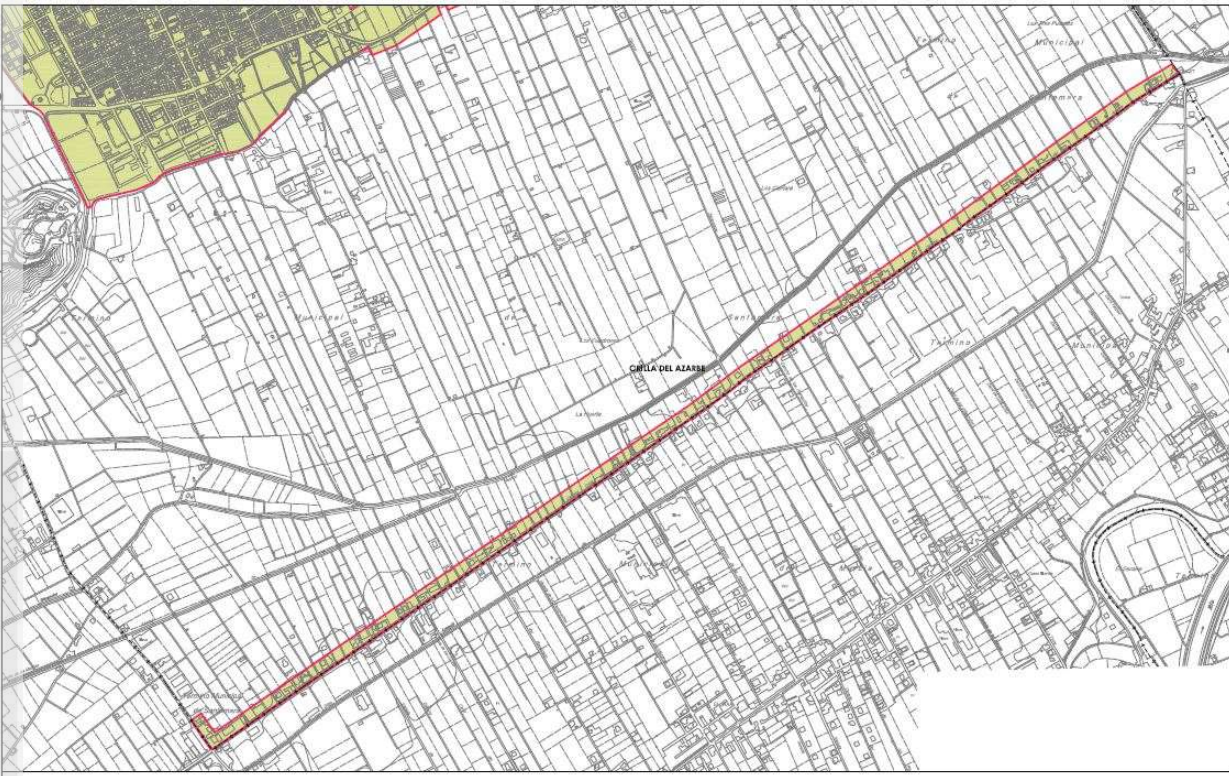
Ámbito Orilla de Azarbe.