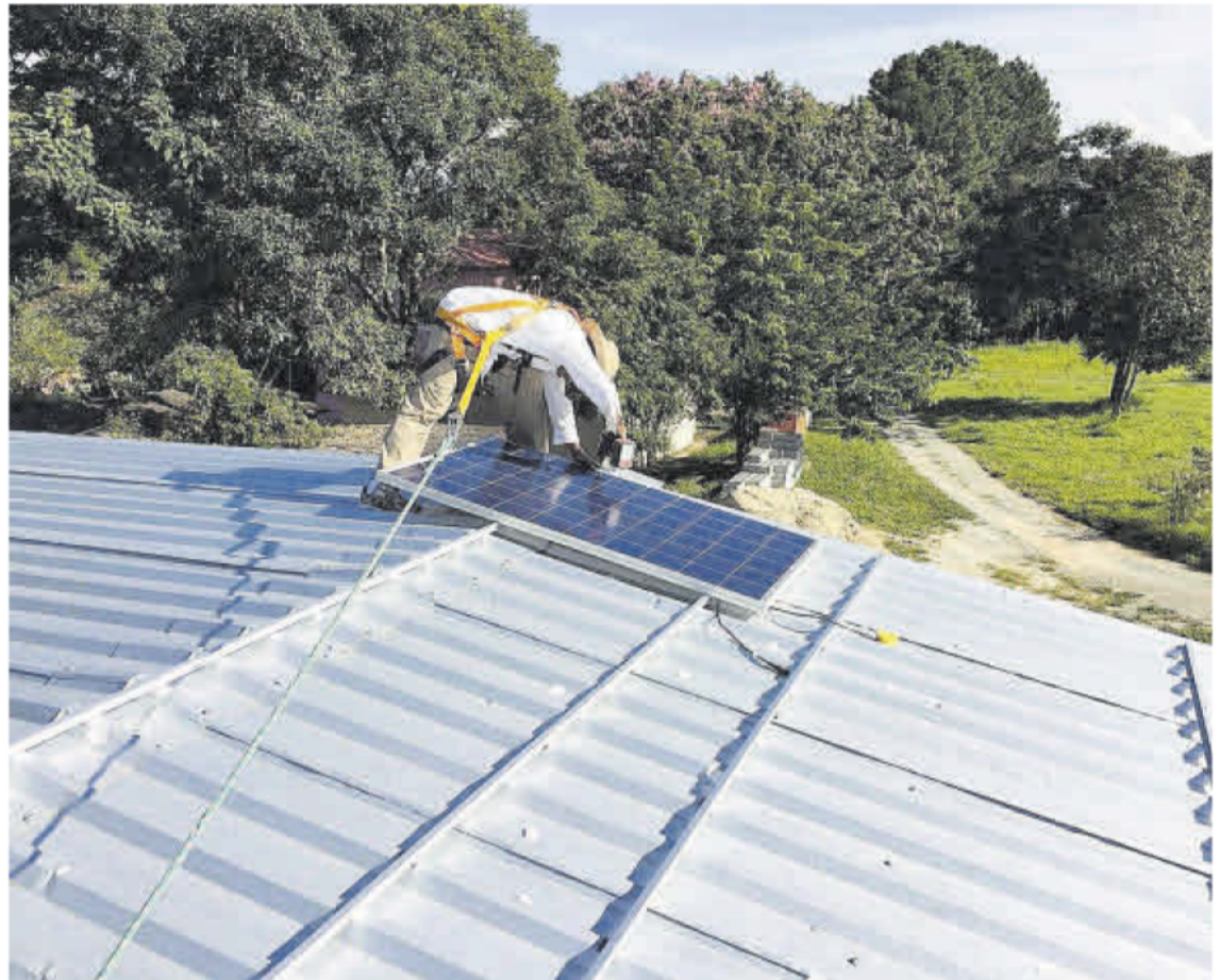
Instalación de una planta fotovoltaica en una finca.