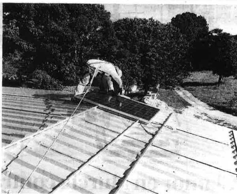
Instalación de una planta fotovoltaica en una finca.